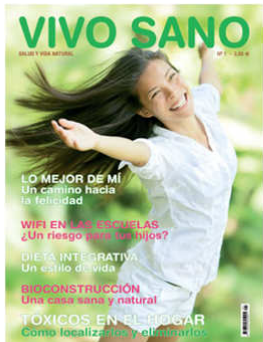
Número 1 de la Revista Vivo Sano

También hemos publicado el primer número de la Revista Vivo Sano, que recoge toda la actualidad de la Fundación, así como del mundo de la salud natural.