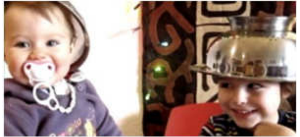
Video Peligros de las radiaciones para los niños