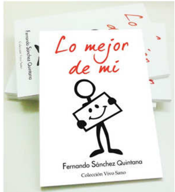
Libro Lo mejor de mí