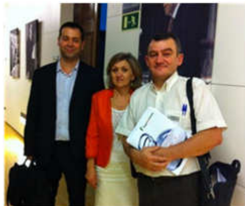
Reunión con los representantes del PSOE